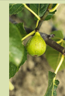
Figue de Marseille