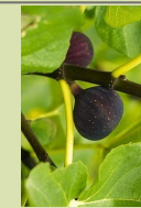
Noire de Barbantane