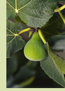
Col de Dame blanc