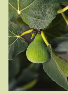
Col de Dame blanc