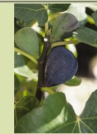
Noire de Caromb