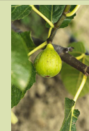
Figue de Marseille