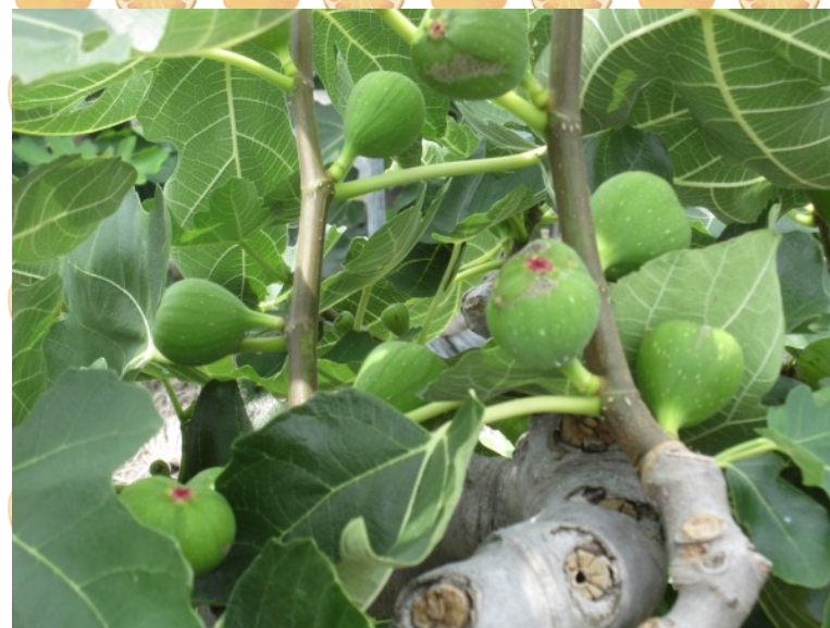
(一面のいちじく畑)