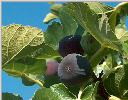
Miljska figa -okusna in privlačna