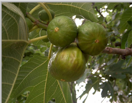
Bela petrovka - prvi rod