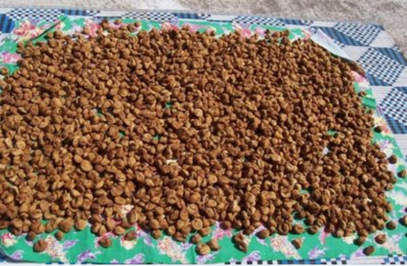
Tekrar serilmiş olan incirler.

Bizim incirlerin büyük çoğunluğu taze olarak satılıyor. Bir miktar da kuru incir oluyor. Kuru inciri de iki şekilde saklıyoruz. 1. Bandırarak, 2. Kavurarak.