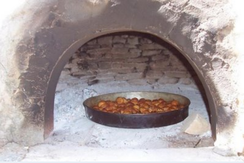
Veee, incirler fırında...