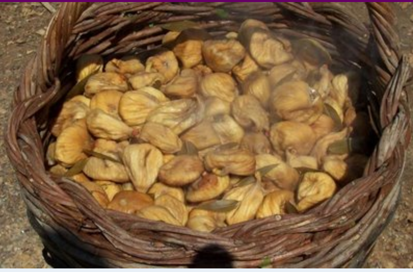
Bandırılmış ve dumanı tüten incirler. Yumuşacık ve pırıl pırıl...