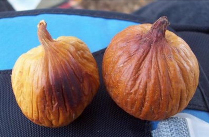
Fırında kavrulmuş ve şişmiş olan incirler