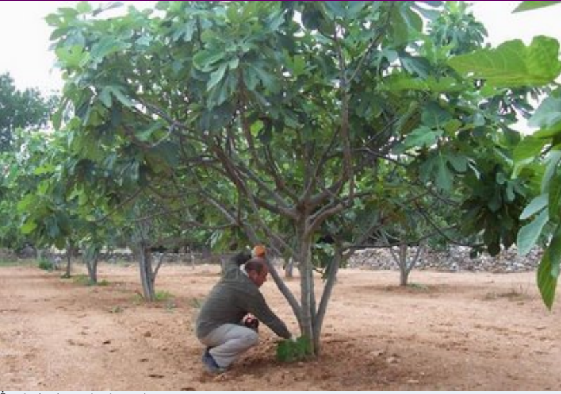
İncir bahçesinde çalışma.

İncir ağacı yukarıda görüldüğü gibi, topraktan itibaren bırakılan dallarla da taçlandırılabilir.