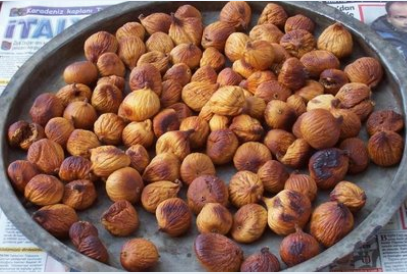
Nar gibi kızarmış, mis gibi kokan ve tombik tombik olmuş incirler. Bunların içine herhangi bişey konulmadı.