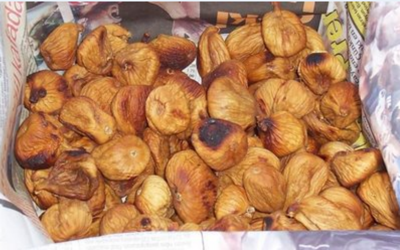
Artık eskisi kadar bir sandıklık incir olmuyor. Daha doğrusu yapmıyoruz diyelim. Bir karton kolinin içine koyduk.