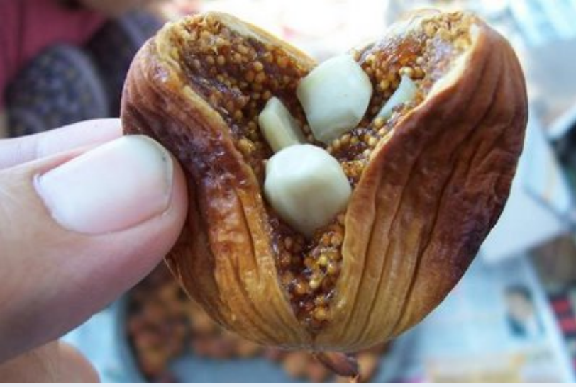
Kızarmış bir incir. İçinin bademiyle beraber :)