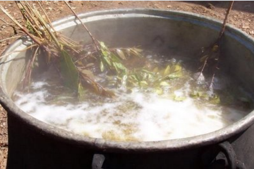
Defne, mersin ve kekik dalları konulan su kaynıyor.