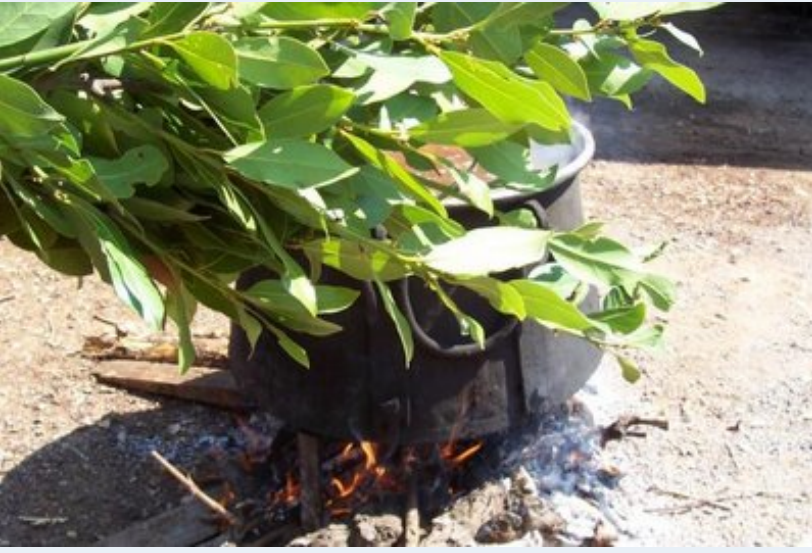
Kazan kuruldu, su kaynamaya başladı. Ön planda görünenler de suyun içine konulacak olan defne yaprakları. Defne yapraklarıyla beraber, mersin ve kekik de konulacak.