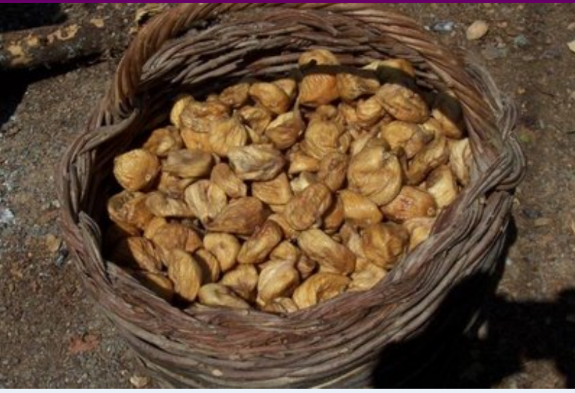
Kurutulmuş incirler, yıkandılar ve sepete konuldular.