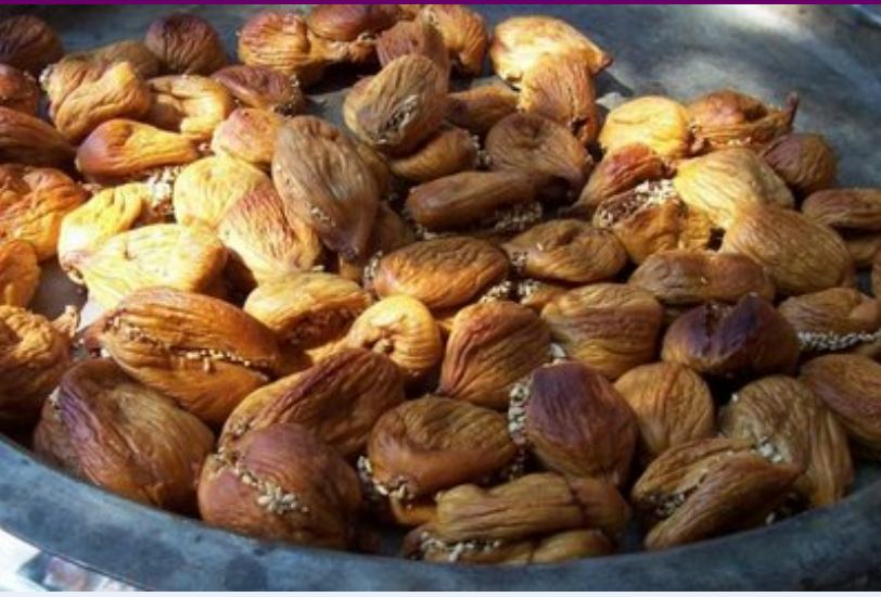
Bunlar da içine susam ve badem içi konulmuş olan incirler