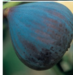
Fruchtfeige Califfo Blue gute blaue Feigensorte, auch für kühlere Standorte CHF 69.00