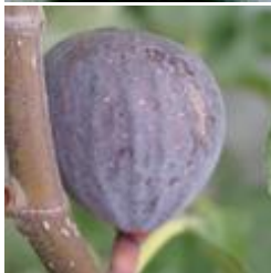
Pastilière Fruchtfeige CHF 55.00