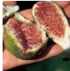
Fruchtfeige Perretta riesige birnenförmige, grünliche Früchte - und das jedes Jahr CHF 69.00