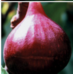
Fruchtfeige Rosetta sehr schöne frühreifenden Sorte CHF 69.00