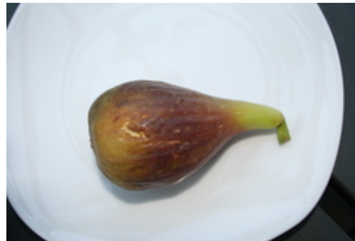
Reiferisse bei der Feige Perretta Wenn die Feige solche Risse aufweist, ist sie Ernte- und Genuss-reif