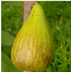
Dalmatie Fruchtfeige CHF 45.00