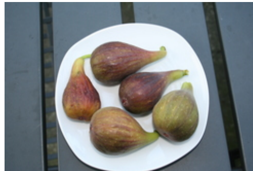
Reife geerntete Gartenfeigen Sorte Perretta Bereit für den Genuss