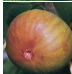
Fruchtfeige Mère Véronique Feige mit etwas kompakterem Wuchs, deshalb gut für die Kübelkultur geeignet, kann selbstverständlich aus ausgepflanzt werden CHF 69.00