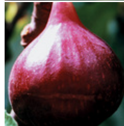
Fruchtfeige Rosetta sehr schöne frühreifenden Sorte CHF 69.00