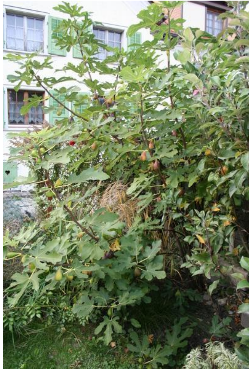
Perretta - unser Feigenbaum Eigentlich steht er nicht am richtigen Standort: in der Nordostecke unseres Grundstücks, mitten im Gebüsch. Trotzdem trägt er regelmässig und reichlich - eine wahre Freude in Herbst