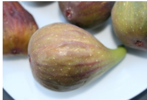
Reiferisse bei Feigen Hier sehen sie die typischen Reiferisse bei Feigen. wenn die Frucht so ist, kann sie geerntet und genossen werden