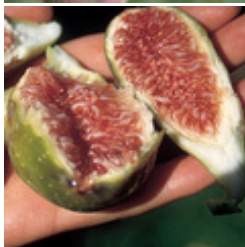
Fruchtfeige Perretta riesige birnenförmige, grünliche Früchte - und das jedes Jahr CHF 69.00