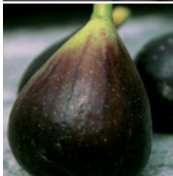
Fruchtfeige Morena gut adaptierte sorte mit violett gefärbten reifen CHF 69.00