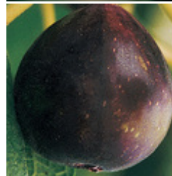
Fruchtfeige Rossa Rotonda fruchtare, rötlich-blaue Feige CHF 69.00