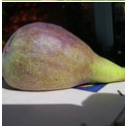
Longue d'Aout Fruchtfeige CHF 45.00