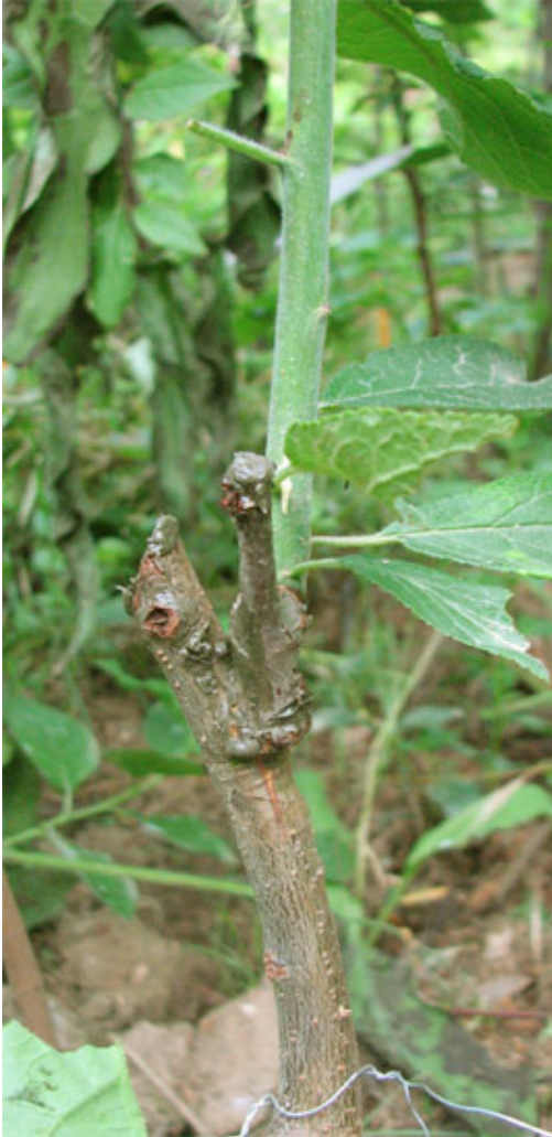
Greffe en cadillac de prunier sur porte-greffe qui présente une courbure : le greffon ainsi implanté a un oeil qui émet une pousse bien verticale