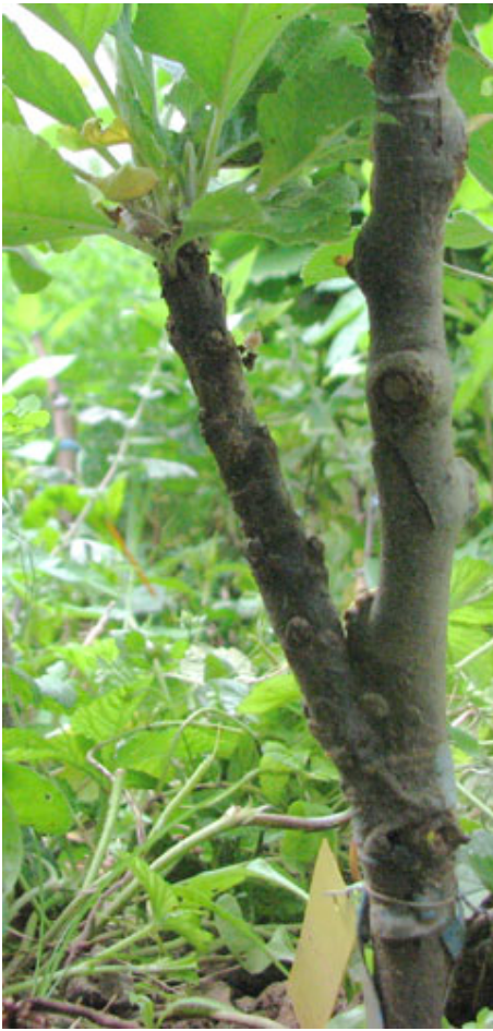
Greffe en cadillac de pomme Reinette Ananas